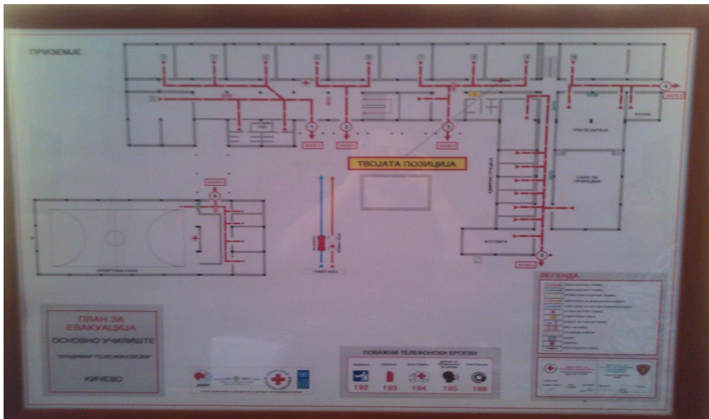
План за прв кат и приземје